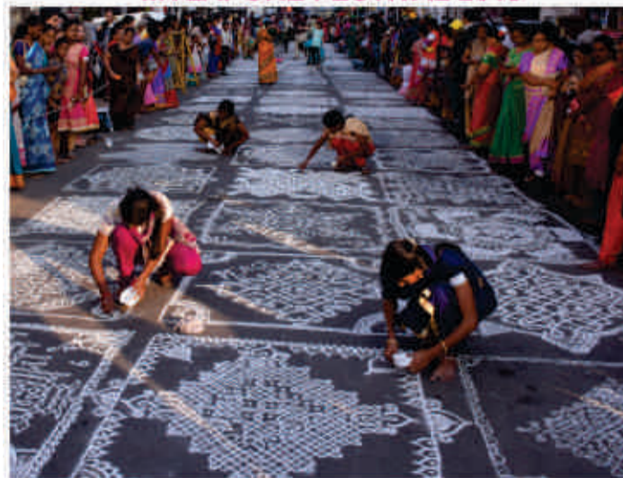
A glance of Kolams for the competition of Mylapore Annual Festival