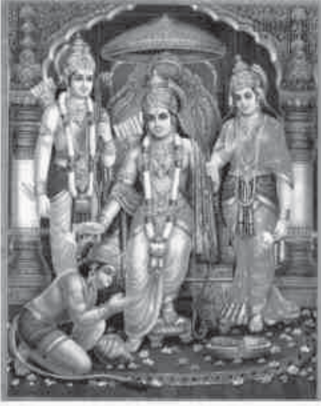
சென்ற வாரத் தொடர்ச்சி.....

தன் உணர்ச்சிகளை எல்லாம் கொண்டுவிட்டு, அவனுடன் உரையாடிய ஊர்மிளை, கணவன் லக்ஷ்மணனின் தலைமறைந்ததும் விக்கி விக்கி அழுதாள். கண்ணீர் வெள்ளத்தில் மூழ்கினாள். ராமனுக்கும் சீதைக்கும் 14 ஆண்டுகள் பணிவிடை செய்யப்போகும் லக்ஷ்மணனுக்குத் தன்னைப் பற்றிய ஆசாபாசங்கள், காதல் நினைவுகள் ஏற்பட்டு, அதனால் அவர் செய்கின்ற பணிக்கு இடையூறு வராமல் இருக்கவேண்டும் என்பதற்காகவே அவள் இப்படியொரு நாடகமாடி, தன் மீது அவனுக்கு முழு வெறுப்பு ஏற்படும்படியாகச் செய்துகொண்டு, கணவன் ஏற்றுக்கொண்ட கடமை எனும் யாகத் தீயில் தன்னையே நெய்யாக்கி ஆஹிதி தந்தாள் ஊர்மிளை. 14 வருடங்கள் அன்ன ஆகாரமின்றி மிக எளிமையாக, சன்யாசினியாக வாழ்ந்தாள். தான் செய்த இந்த தியாகத்தைப் பற்றி அவள் யாரிடமும் கூறவில்லை. லக்ஷ்மணனுக்கும் ஊர்மிளை செய்த இந்தத் தியாகம் தெரியாது வனவாசம் முடிந்து ராமன் அயோத்தி திரும்பி பட்டாபிஷேகம் செய்துகொண்டான். அப்போதும் லக்ஷ்மணன் ஊர்மிளையை ஏற்றெடுத்துக்கூடப் பார்க்கவில்லை.