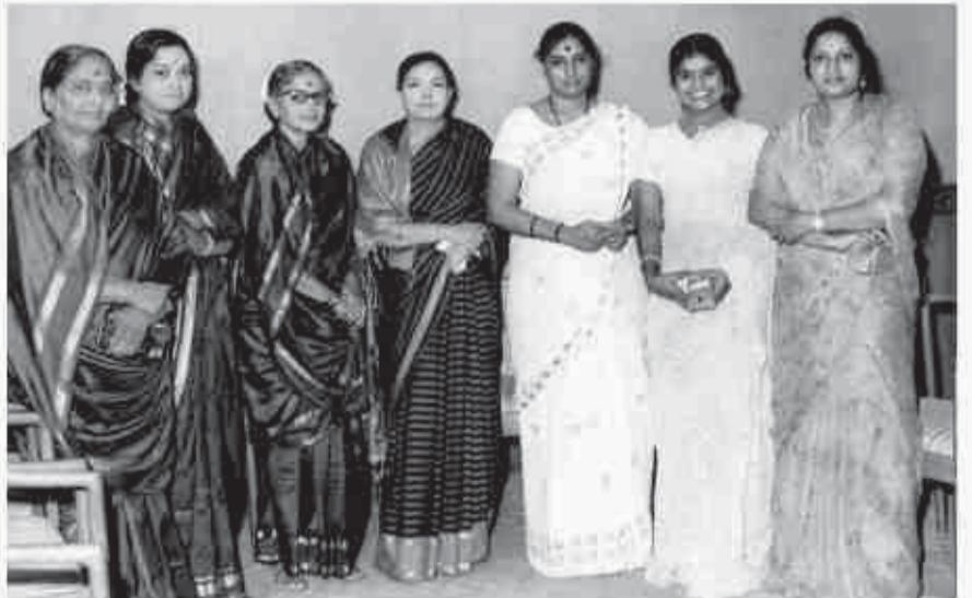
Super Singer Line up Rare Picture D.K.Pattammal, Jayalakshmi, M.S.Subbualakshmi, Radha, S.Janaki, L.R.Eswari and Vani Jayaram

FOR ADVERTISEMENT IN MYLAI EXPRESS CONTACT 9840643902 / 9884944452