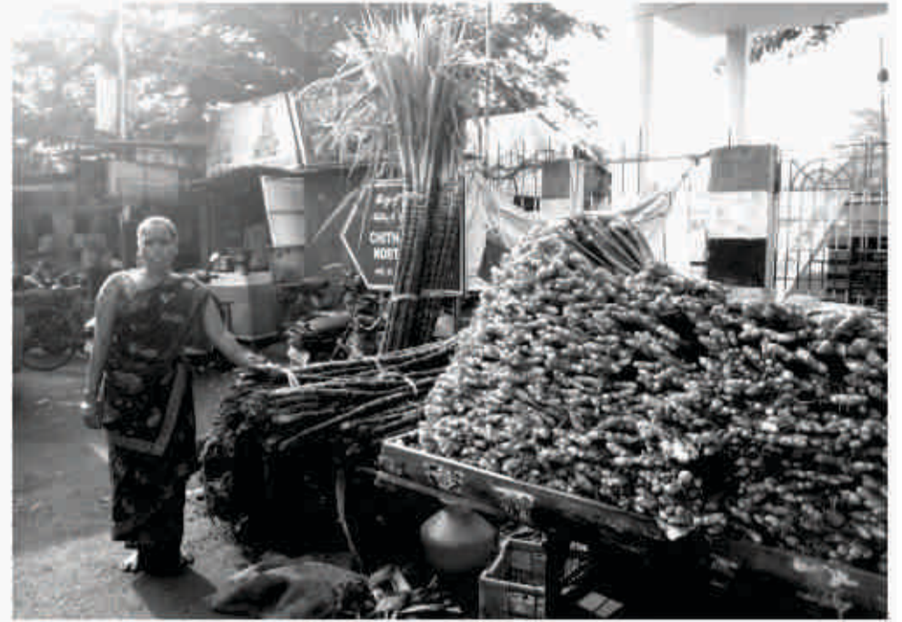
பொங்கல் பண்டிகையை முன்னிட்டு மயிலை மாடவீதிகளில் இஞ்சி, மஞ்சள்கொத்து மற்றும் கரும்பு வியாபாரம் அமோகம்.

FOR ADVERTISEMENT IN MYLAI EXPRESS CONTACT 9840643902 9884944452