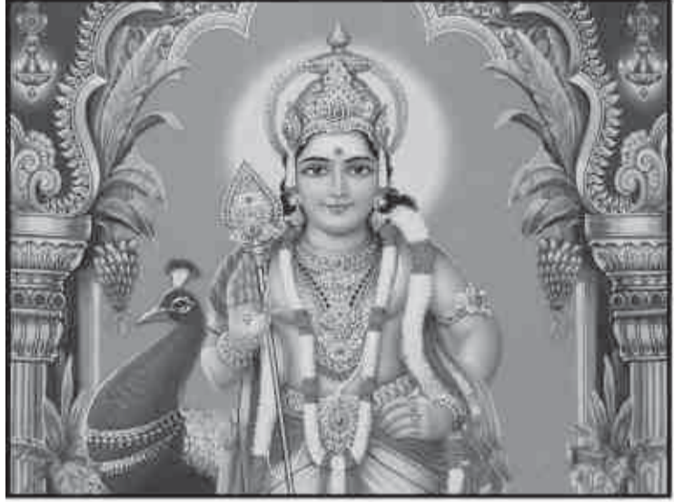
பாதயாத்திரையாக வரும் பக்தர்கள், மார்கழி மாத ஆரம்பத்தில் துளசி மாலை அணிந்து விரதத்தை தொடங்குவார்கள். சஷ்டிகவசம், சண்முக கவசம், திருப்புகழ் போன்ற பாடல்களை அன்றாடம் பாராயணம் செய்து தைப்பூசத்தன்று பழனி முருகன் கோயிலில் சிறப்பு வழிபாடு செய்து விரதத்தை முடிப்பார்கள்.

தமிழ் கடவுளான முருகப்பெருமானின் திருவிழாக்களில் முக்கியமானது தைப்பூசம் ஆகும். 27 நட்சத்திரமண்டலங்களில் எட்டாவது நட்சத்திரமாக பூசம் அமைகின்றது. தை மாதத்திலே வரும் பூச நட்சத்திரம் புண்ணிய நாள் தைப்பூச விழாவாக இந்துக்களால் கொண்டாடப்படுகின்றது. தைப்பூசம் வரும் நாள் பெரும்பாலும் நிறைமதி நாளாக (பூரணை நாளாக) இருக்கும். தைப்பூசம் முருகப்பெருமானுடைய விஷேட தினமாகும். அன்றைய தினம் குழந்தைகளுக்கு தோடு குத்துதல்,