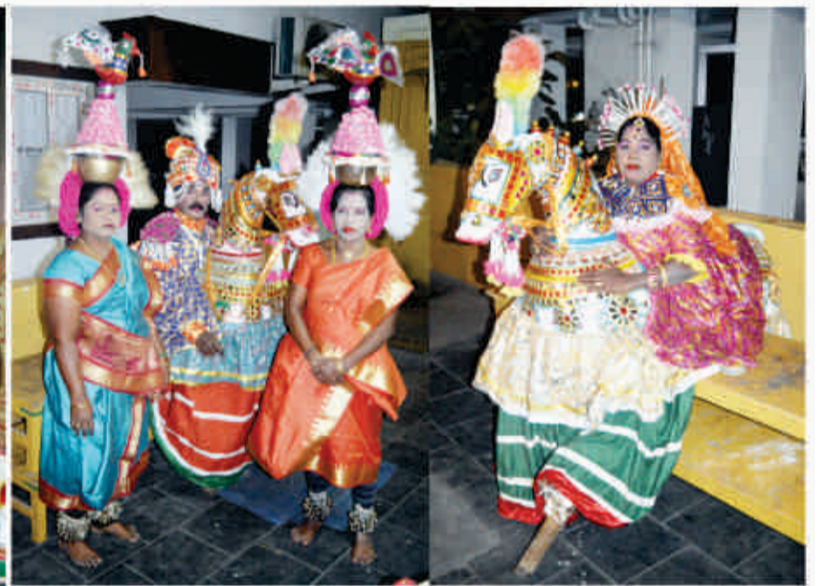
SNAPSHOTS OF URUR OLCOTT KUPPAM VIZHA celebrations PAVA KATHAKALI, POIKAL KUTHIRAI & KARAKATTAM shows @ Ragasudha Hall, Luz Mylapore on 21 st January.